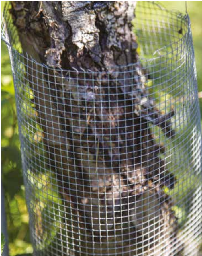
Siswaniso sa bubeli: Sesi sileleza kota

Kutisa mayemo awo kuona kozi kwa mililo ni likokwani sina tufolofolo totu nyinyani ni mifuta ya lipeba ikona ku fukuzwa.