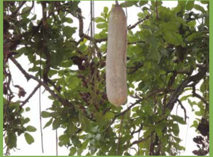
Siswaniso sa bubeli: Kota ya mupolota mwa mushitu mutulo wa Namibia

Nako yeo sibaka sa muubu hase si ketilwe, milulwani i lukela ku beiwa kaku belekisa mabalelo, ili kuli balisani babe ni zibo ya kuli ba lukela kuisa limunanu zabona kwa hule ni sibaka seo. Hakuna ni kozi kapa kufita mwa sibaka isi ka mulao ni sinyehelo bakeñisa ku fula kapa limunanu ze fita, milulwani ya lukwakwa itokwa ku yahiwa. Kubeya lukwakwa kwa tula mi kika cwalo haku tokwa feela ku beiwa lukwakwa haiba misebezi yemiñwi ya silelezo haina ku beleka ka swanelo. Lukwakwa mwa libaka za milulwani hape lukona ku yahiwa kaku belekisa mitai ya likota ye wile, sina mulaka. Buiketelo bobuñwi kiku belekisa silelezo ya likota ku sileleza likota ze nyinyani kwa lifolofolo ze fita. Nako yeo musebezi waku lima limela hase u simuluzwi mi likota seli hulile hande ka butelele, lukwakwa lukona ku zwiñwiwa niku belekiswa hape kwa sibaka sisili saku limela.