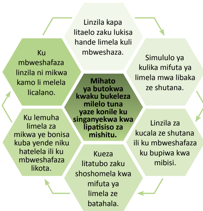
Sisupo ya pili: Mihato ya butokwa kwaku bukeleza milelo ya lipatisiso za mishitu (MAWF, 2011)

Kakuya ka muhato wa lipatisiso za mishitu, mulelo tuna waku lima kapa kucalwa kwa likota mwa Namibia ki ku eza lipatisiso zaku zwisezapili libelekiso zaku calisa ze swanela kapa ze konile ku añulwa mwa mayemo a lihalimu a Namibia a womile. Ku bukelezwa kwa zeo kui tingile kwa mihato ya butokwa ye sikai.