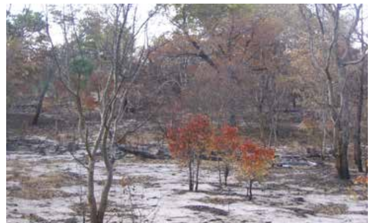
Siswaniso sa bubeli: Mushitu kasamulaho aku cisa mulilo

Moo ku fumaneha ku mbweshafaza muubu ka nzila yaku cisa kapa kukwalula sikapani sa peu ili nzila yaku susueza kumela. Kalulo ya kucisa ka nzila ye lukisizwe mwa libaka feela ze leliwe ki taba ye susueza kwa mafelelezo a nako yeo muubu hau kolobile (likweli za kandao ni sikulu) kusabisa mililo ye cisa ahulu yekona akutisa sinyehelo tuna kwa limela. Mifuta ye cwale ka mulombe ( Pterocarpus angolensis ) ka simuloho itokwa mulilo kuli likone ku shoshomela. Kono nihakuli cwalo seku fumanehile kuli haki kucisa kwa mulilo feela kono sihulu-hulu ki nzila kamo uciseza kamita koku susueza kumela