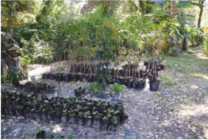
Siswaniso sa pili: Sibaka koku calwa limela mwa tolopo ya Katima Mulilo